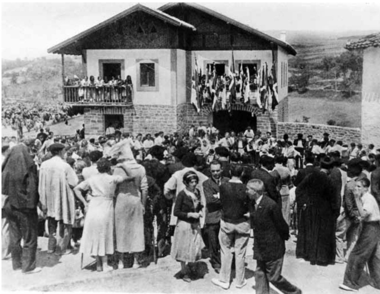
8. Menagaraiko Batzokiaren inaugurazioa (1934ko uztailaren 29) Inauguración del Batzoki de Menegarai (29 julio de 1934).