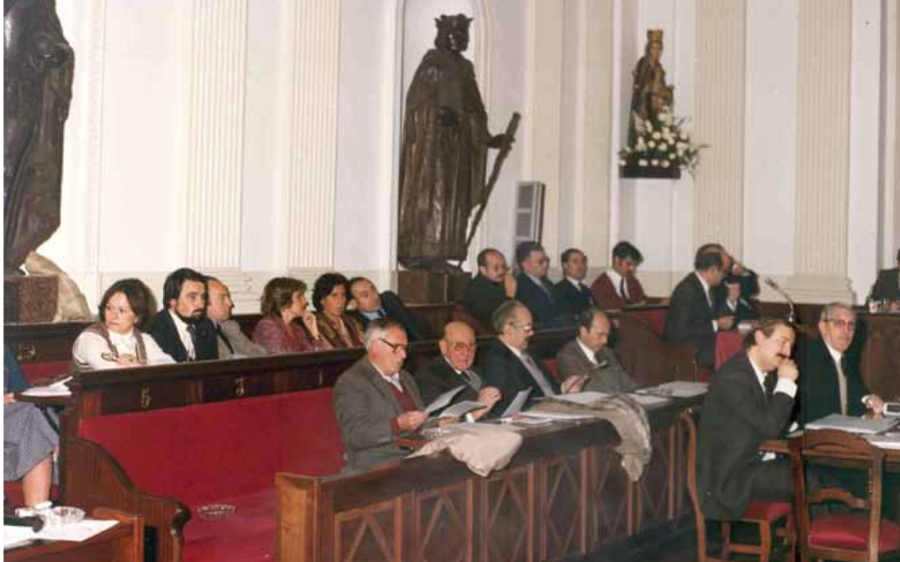
16. Arabako Biltzar Nagusien Osoko Bilkura Tradizionala (1980ko azaroa). Pleno Tradicional de las Juntas Generales de Álava (noviembre de 1980).