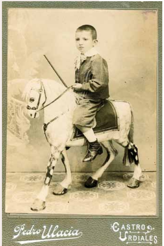
2. Umetako argazkia. Fotografía de infancia.